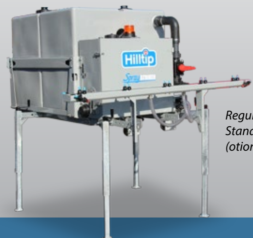
Regulierbare Standbeine (optional)