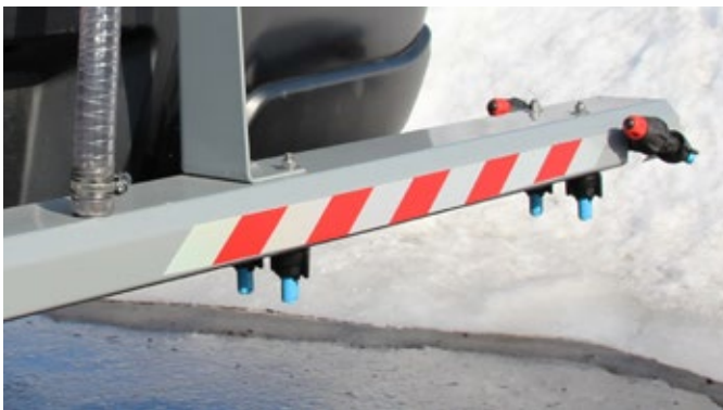
Doppelte Sprühdüsen für Enteisung selbst bei hohen Geschwindigkeiten

Abstellsystem für ein leichtes auf und abladen bzw. Lagern des Gerätes