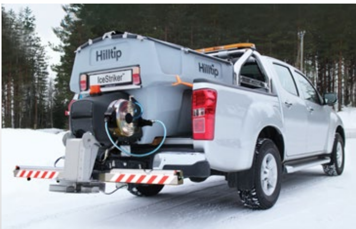
Optionale Salzwassersprühbalken und Schlauchspule