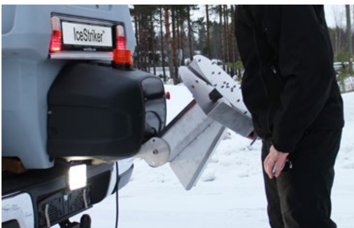
Klappbare Edelstahl-Spinner, entwickelt auch zum Streuen von sehr feuchtem Salz.