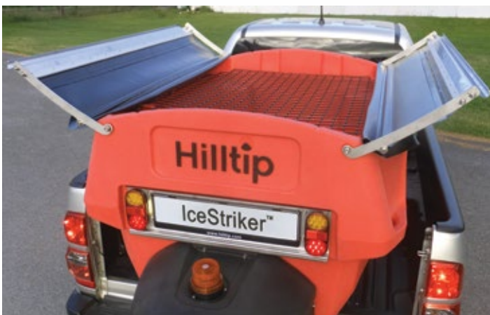
Zweiteiligen Planenmechanismus und Gitter