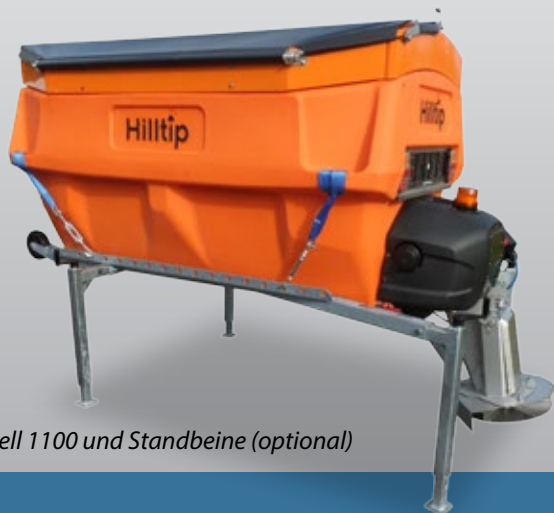
Modell 1100 und Standbeine (optional)