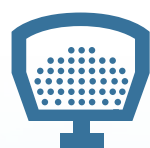
STANDARD Salz & Sand

Unser Streuer ist entsprechend den Bedürfnissen von Nutzfahrzeugen und kleinen europäischen Pickups gebaut. Der leichte Streugutbehälter aus Polyethylen bietet Ihnen zusammen mit den Baugruppen aus Edelstahl einen langlebigen Schutz vor Korrosion und Rost. Zusätzlich bietet dieses einzigartige All-in-One Streuer integrierte Tanks für das optionale Flüssigkeitssystem.